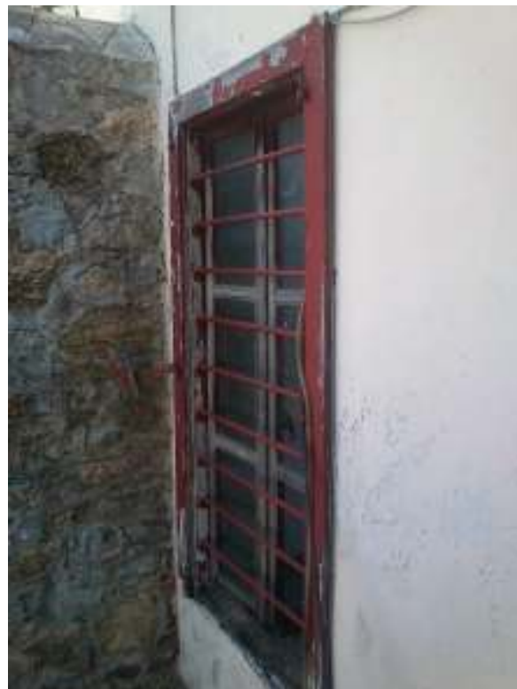
Προσβολή από υγρασία και σήψη του ξύλινου παραθύρου στην βορειοδυτική πλευρά του κτηρίου.