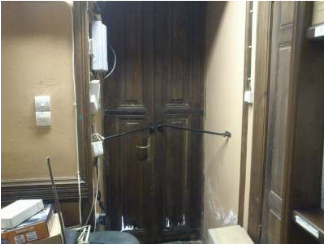
ΓΑΚ-Αρχεία Ν.Εύβοιας. Προσβολή από υγρασία και σήψη της ξύλινης εξωτερικής ταμπλαδωτής θύρας στην βορειοδυτική πλευρά του κτηρίου.