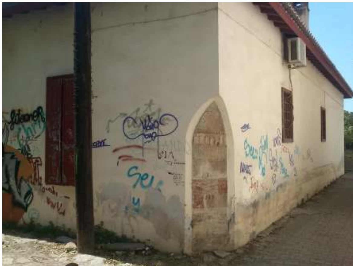
Η ανατολική γωνία του κτηρίου με την λοξότμητη απότμηση.