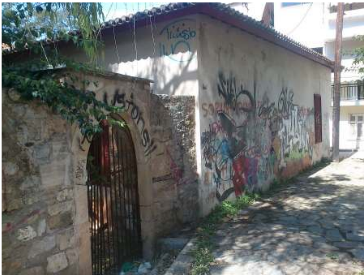
Περιμετρικός τοίχος στην νοτιοανατολική πλευρά του κτηρίου.