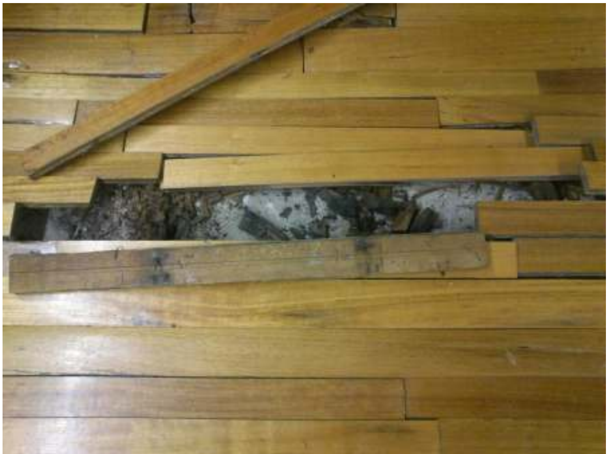
Σήψη των καδρονιών του ξύλινου σκελετού του πατώματος.