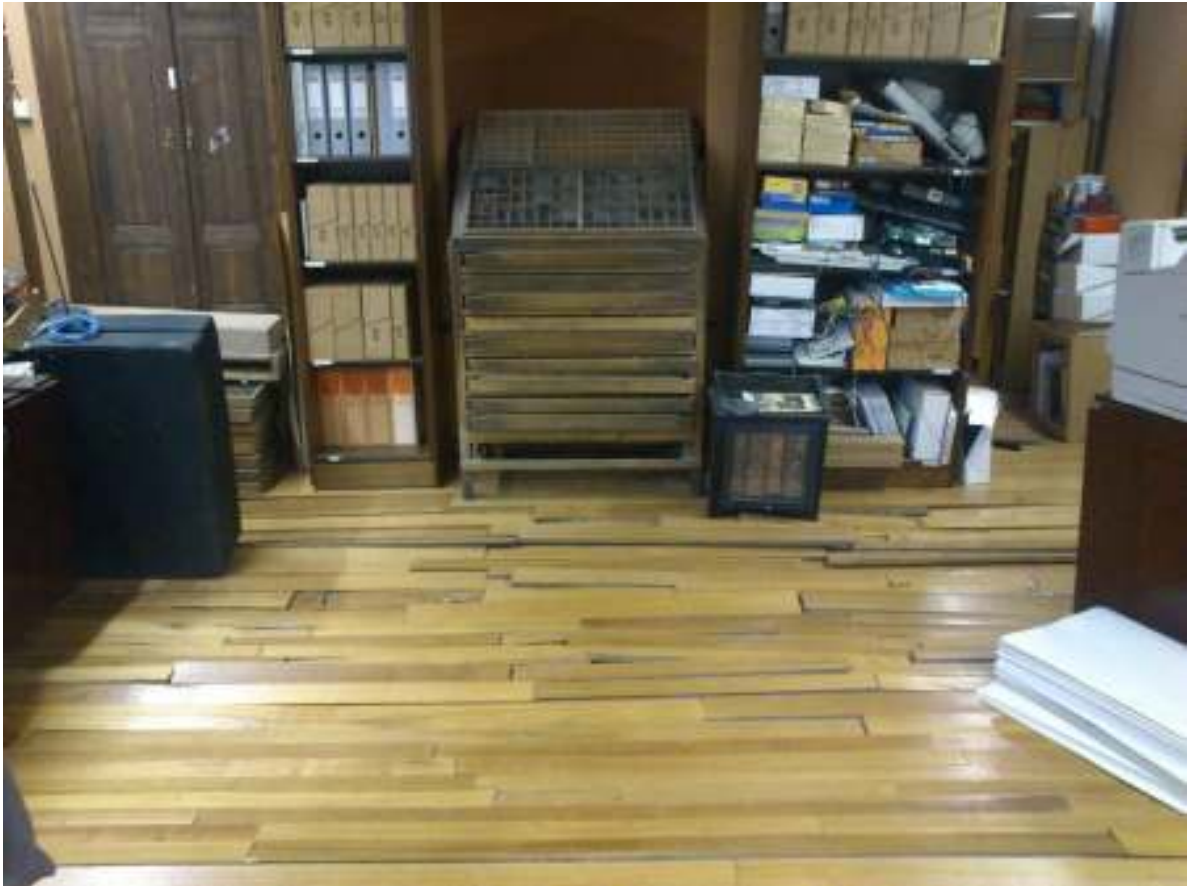
Αποδιοργάνωση των δρύινων λωρίδων του πατώματος.