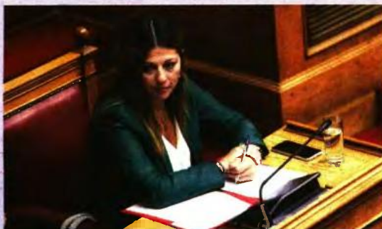
«Οι αναπληρωτές μας θα μείνουν στις θέσεις τους μέχρι το τέλος της φετινής σχολικής χρονιάς», τονίζει η κ. Ζαχαράκη.

Προγραμματική δέσμευση μας ήταν ένα πρότυπο και ένα πειραματικό στην έδρα κάθε περιφερειακής ενότητας».