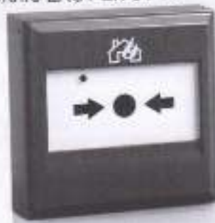
Απεικόνιση χειροκίνητου κομβίου συναγερμού.

Γενικά τα χειροκίνητα κομβία συναγερμού (Σχ 5.4) πρέπει να έχουν τον ίδιο τρόπο λειτουργίας και κατά προτίμηση να είναι του ίδιου τύπου σε όλη την προστατευόμενη εγκατάσταση. Για τα χειροκίνητα κομβία συναγερμού (εκκνητές χειρός) έχει εφαρμογή το πρότυπο ΕΛΟΤ EN 54-11.