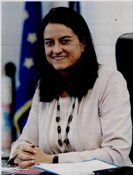
Μη μισθολογική εξέλιξη και παρακράτηση μισθού για περίοδο έως και ενός μνός θα είναι οι συνέπειες για τους εκπαιδευτικούς που θα αρνηθούν τη συμμετοχή τους στην αξιολόγηση, λέει η υπουργός Παιδείας Νίκη Κεραμέως.

– Σύμφωνα με υπολογισμούς, 30.000-40.000 εκπαιδευτικοί θα εμπλέκονται σε επάλληλες διοικητικές και αξιολογικές βαθμίδες. Σας κατηγορούν ότι έτσι στήνεται έναν τεράστιο γραφειοκρατικό μηχανισμό, όπου το ένα επίπεδο αξιολογεί/ελέγχει/μοριοδοτεί το άλλο και όλη αυτή η διαδικασία κατευθύνεται από το υπ. Παιδείας. – Αντιθέτως, δημιουργούμε ένα πλαίσιο αυξημένης αυτονομίας, αναβαθμίζοντας τον ρόλο των εκπαιδευτικών, οι οποίοι αποφασίζουν πλέον για περισσότερα και ουσιαστικά ζητήματα. Οι θέσεις ευθύνης παραμένουν περίπου 15.000, αριθμός απολύτως λογικός προκειμένου να λειτουργεί σωστά το εκπαιδευτικό σύστημα με πάνω από 1,4 εκατομμύριο μαθητές. Με το νέο σύστημα στελεχών, προχωρούμε σε τρεις θεμελιώδεις αλλαγές. Η πρώτη είναι ότι δημιουργούμε μηχανισμό αξιολόγησης εκπαιδευτικών και στελεχών, στον οποίο αποδίδουμε ιδιαίτερη σημασία για τη λειτουργία και κυρίως για τη βελτίωση της εκπαίδευσης. Η αξιολόγηση δεν συνιστά καθοριστική προϋπόθεση για γραφειοκρατικό μηχανισμό. Συνιστά καθοριστική προϋπόθεση για να αποτυπωθούν τα θετικά στοιχεία αλλά και οι αδυναμίες, και με βάση την αποτύπωση αυτή να βελτιωθεί και να εξελιχθεί το εκπαιδευτικό σύστημα. Η δεύτερη, ότι ενισχύ-