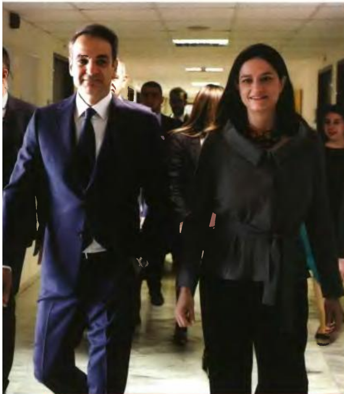
Η πιο νέα γυναίκα υπουργός της Ελλάδας βαδίζει στο πλευρό του πρωθυπουργού Κυριάκου Μητσοτάκη.

πολύ, οπότε από νωρίς κατευθύνθηκα εκεί». Σπούδασε στο Παρίσι, στο Πανεπιστήμιο της Paris II. «Η Γαλλία έχει μεγάλη παράδοση στη Νομική. Ήταν πρόκληση να μπορέσω να σταθώ σε ένα περιβάλλον πολύ απαιτητικό. Χρειάζοταν μεγάλη πειθαρχία και ήθελα να πετύχω υψηλές επιδόσεις». Πράγματι τελείωσε πρώτη και στα δύο πτυχία. Χρειάστηκε να κάνει επαναστάσεις στη ζωή της; «Όχι σπουδαίες επαναστάσεις, ίσως κάποιες μικρές», χαμογελάει. «Θυμάμαι ένα καλοκαίρι σε νησί που μαζί με τα ξαδέρφια μου βγήκαμε κρυφά στις τέσσερις τα ξημερώματα, πήραμε τα ποδηλάτά μας και ξεκινήσαμε! Αλλά εγώ δυστυχώς έπεσα και κατέληξα με ράμματα στο νοσοκομείο. Κάπως άδοξα τελείωσε αυτή η περιπέτεια». Μετά το Παρίσι συνέχισε τις σπουδές της στο Harvard. Έγινε μέλος στον δικηγορικό σύλλογο της Νέας Υόρκης και ξεκίνησε να δικηγорεί. Μέχρι που κάποια στιγμή αποφάσισε να επιστρέψει στην Ελλάδα. «Ξύπνησα ένα πρωί, όταν ήμουν 27 ετών, με τη σκέψη ότι η ζωή μου στην Αμερική είναι μια χαρά και σε επαγγελματικό και σε κοινωνικό επίπεδο αλλά ήθελα να ζήσω στην Ελλάδα. Είχαν περάσει εν τω μεταξύ κάποια χρόνια και ένιωσα ότι αν δεν γυρνούσα τότε δύσκολα θα γυρνούσα αργότερα. Σαν να έχανα την ευκαιρία κάπως. Η ζωή στην Ελλάδα έχει μοναδικά πλεονεκτήματα».