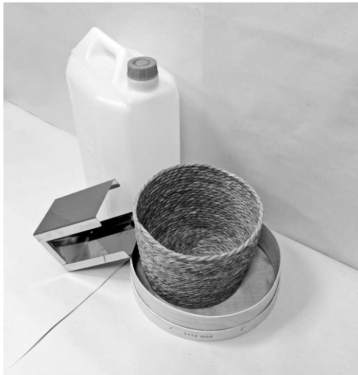
έκτη φωτογραφία: άποψη υπό γωνία