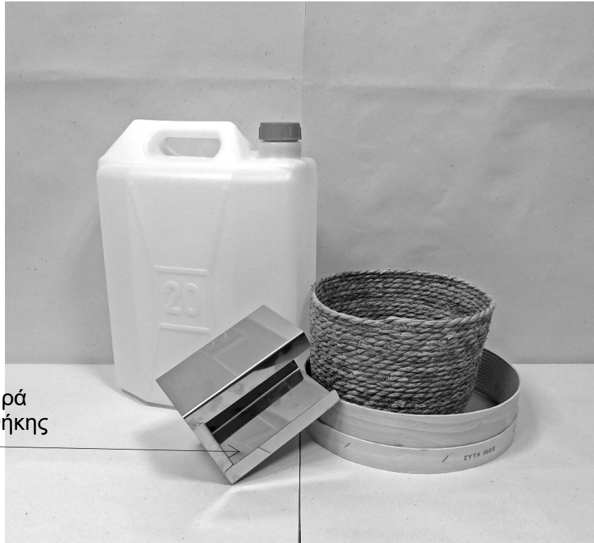
πρώτη φωτογραφία: μπροστινή όψη