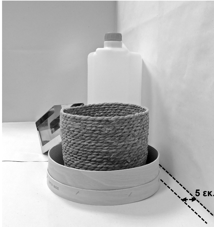
τρίτη φωτογραφία: πλάγια όψη 1