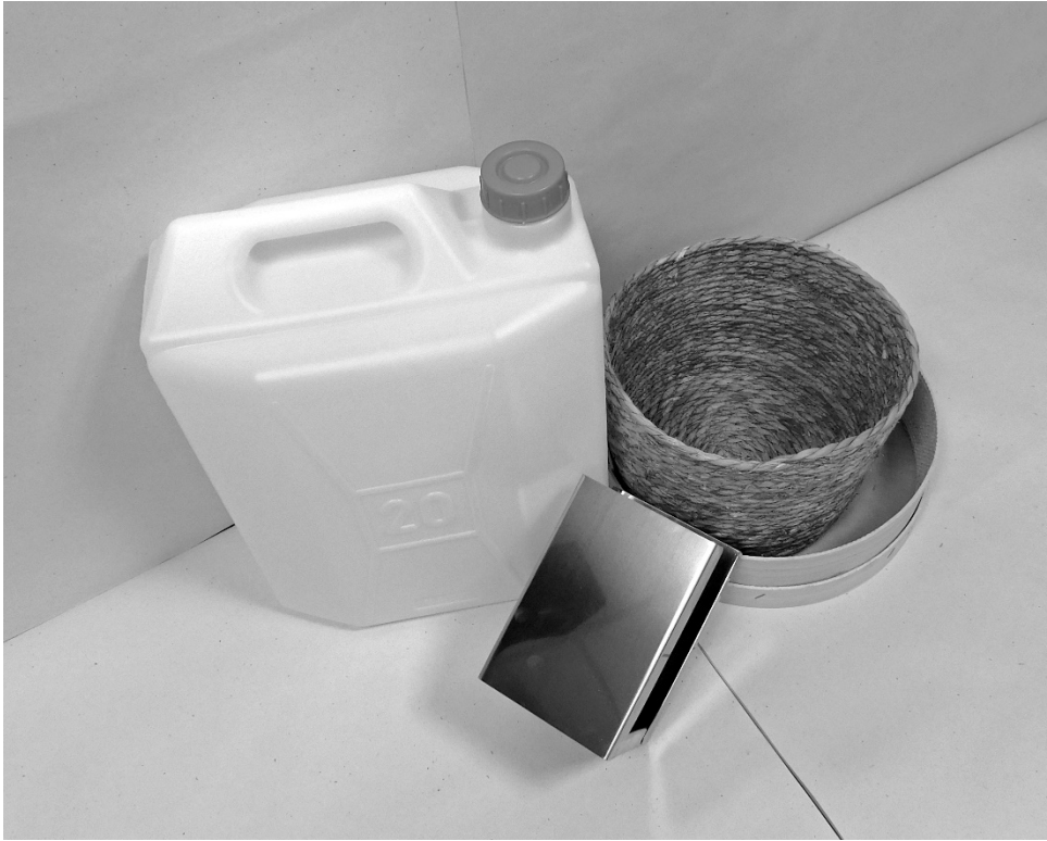
πέμπτη φωτογραφία: άποψη υπό γωνία